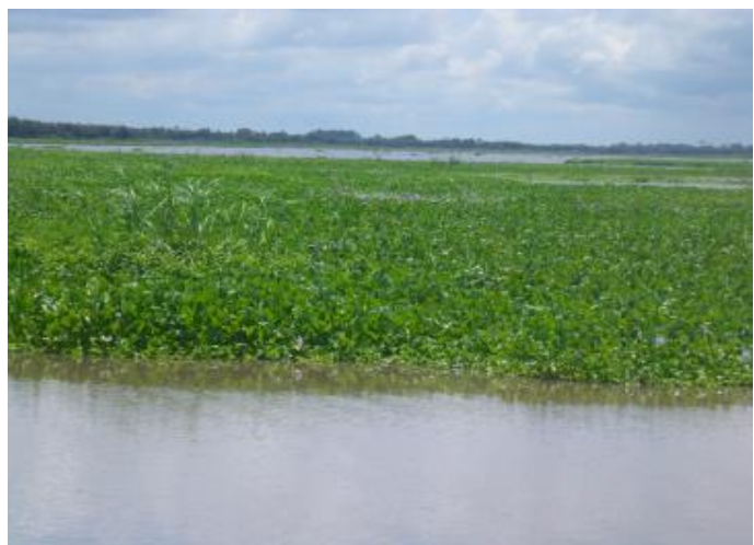
Prolifération de la jacinthe d'eau sur le Lac Nokoué

Afin d'appuyer les communautés à faire face à ces défis, le PROJEC vise valoriser la jacinthe d'eau à travers le compostage et la vannerie , et valoriser sur le marché du carbone la réduction des émissions de gaz à effet de serre induite par le projet . Cette initiative est supportée par l'Union Internationale pour la Conservation de la Nature (UICN)