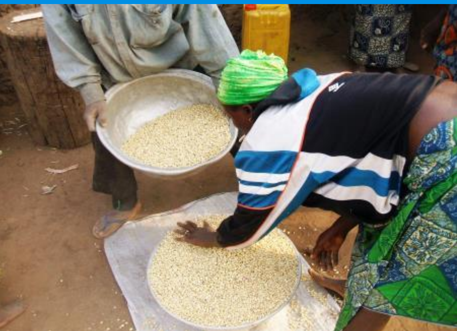
Une femme préparant le maïs pour le stockage

« Soutenir les petites exploitations agricoles pour une agriculture plus performante »