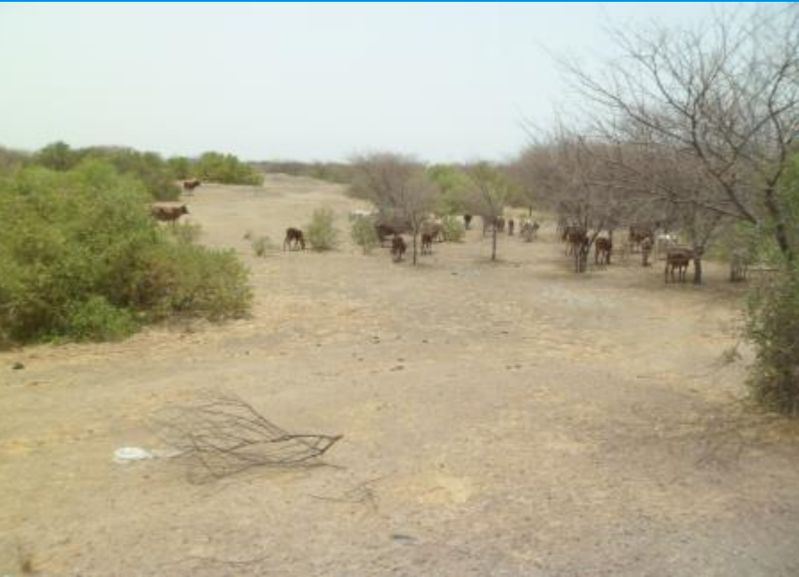
Sécheresse au Nord-Bénin

« Accompagner les communautés vulnérables dans la lutte contre les changements climatiques »