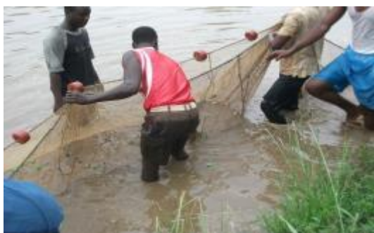
Des jeunes préparant des filets piscicoles

Le projet de renforcement des capacités des jeunes autochtones Aïzo (PREJAT) est une initiative qui a démarré en 2012 et qui s'est achevé en Décembre 2013. Il a été initié à partir du constat que la communauté Aïzo, peuple indigène du Sud Bénin, est caractérisée par un fort taux de chômage dans sa couche juvénile s'expliquant par un faible niveau d'instruction et de qualification des jeunes de la communauté.